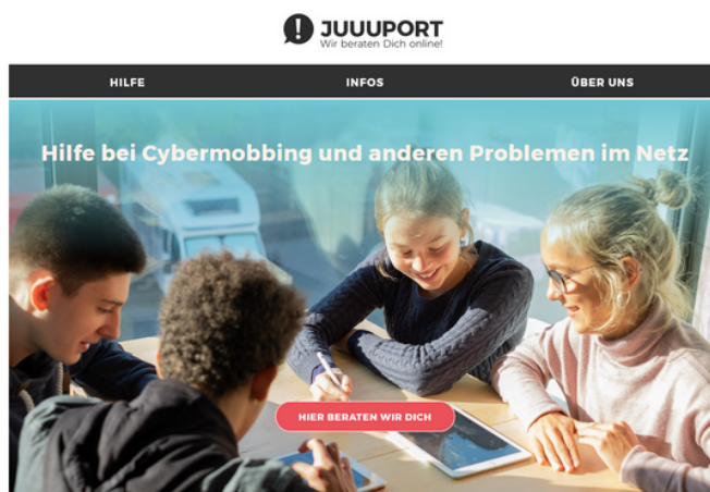
„Wir, die JUUUपोर्ट-Scouts ...“

Der Verein bildet junge Menschen zu JUUUपोर्ट Scouts aus, die sich an dem Projekt beteiligen. In den Schulungen erlernen die Scout-Kandidat:innen die wichtigsten Grundlagen für ihre ehrenamtliche Beratungsarbeit von Expert:innen aus den Bereichen Recht, Internet- und Online-Beratung. Die Scouts helfen ihren Mitschülern und Mitschülerinnen bei Problemen und geben Online-Seminare.